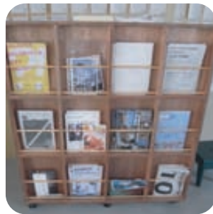
☞ PRブース、ラウンジへ