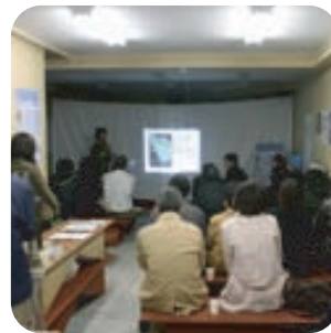
☞ PRブース、オフィスへ